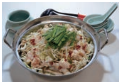
福泉操特製 もつ鍋(一人前) ¥1,510