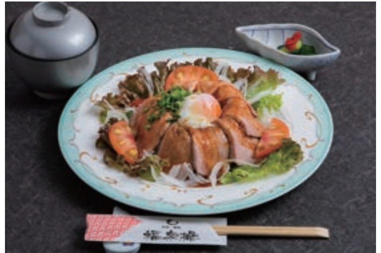
ローストビーフ丼 ¥1,650