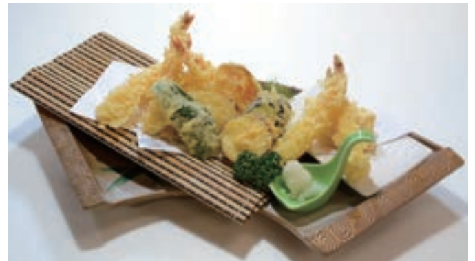
おまかせ天ぷらの盛合わせ ¥1,408