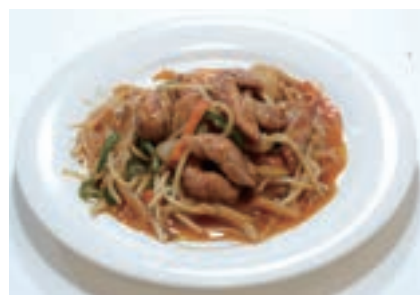
豚とモヤシ辛みそ炒め ¥550